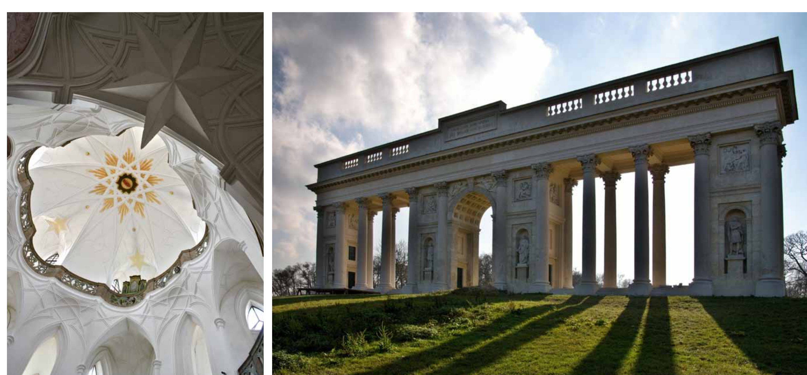
Zelená hora. Foto: Gabriela Čapková, 2009, © NPÚ Valtice. Foto: Ladislav Bezděk, 2008, © NPÚ

Aufgrund der Konvention wird fortlaufend die Welterbeliste aufgestellt, in die Kultur- und Naturgüter eingetragen werden, denen vom Welterbekomitee „außergewöhnlicher universeller Wert“ zuerkannt wird. Die Tschechische Republik hat derzeit zwölf in die Welterbeliste aufgenommene Kultur- und Naturgüter, die nachstehend aufgeführt sind: das Historische Zentrum von Prag (1992), das Historische Zentrum von Český Krumlov (1992), das Historische Zentrum von Telč (1992), die Wallfahrtskirche des hl. Johannes Nepomuk auf Zelená hora (1994), Kutná Hora: historischer Stadtkern mit St. Barbarakirche und der Mariendom in Sedlec (1995), die Kulturlandschaft Lednice-Valtice (1996), die Historische Dorf-Reservierung Holašovice (1998), Gärten und Schloss in Kroměříž (1998), Schloss Litomyšl (1999), die Dreifaltigkeitssäule in Olomouc (2000), die Villa Tugendhat in Brno (2001), das Judenviertel und die St. Prokop-Basilika in Třebíč (2003).