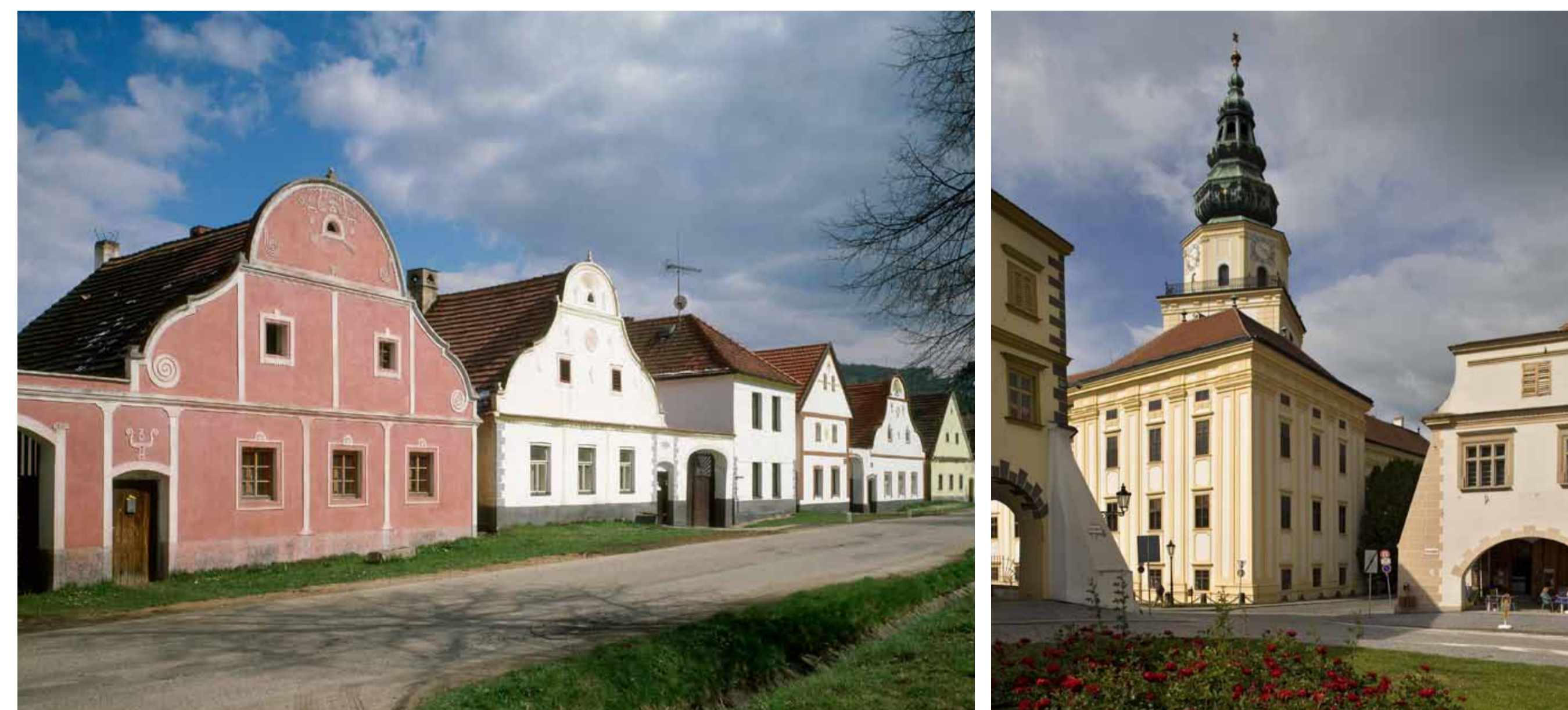
Holašovice. Foto: Ladislav Bezděk, 2008, © NPÚ Kroměříž. Foto: Gabriela Čapková, 2009, © NPÚ

Aufgrund der Konvention wurden das Welterbekomitee und der Welterbefonds gegründet, die ihre Tätigkeit im Jahr 1976 aufgenommen haben. Das Komitee besteht aus 21 Konventionsstaaten, die im Verlauf einer ordentlichen Tagung der UNESCO-Generalkonferenz gewählt werden. Dem Komitee legen die Signatarstaaten die Listen der Kultur- und Naturgüter auf ihrem Gebiet vor, die den Kriterien für eine Aufnahme in die Welterbeliste entsprechen. Aufgrund von Artikel 14 der Konvention steht dem Komitee ein Sekretariat an der Seite, das vom UNESCO-Generaldirektor in Paris ernannt wird. Die Funktion des Komitee-Sekretariats wird seit 1992 vom Welterbezentrums in Paris als eine Untereinheit des internationalen UNESCO-Sekretariats erfüllt. Die Beziehungen zwischen der Tschechischen Republik und der UNESCO obliegen der Ständigen Delegation der Tschechischen Republik bei der UNESCO, die der Botschaft der Tschechischen Republik in Paris unterstellt ist.