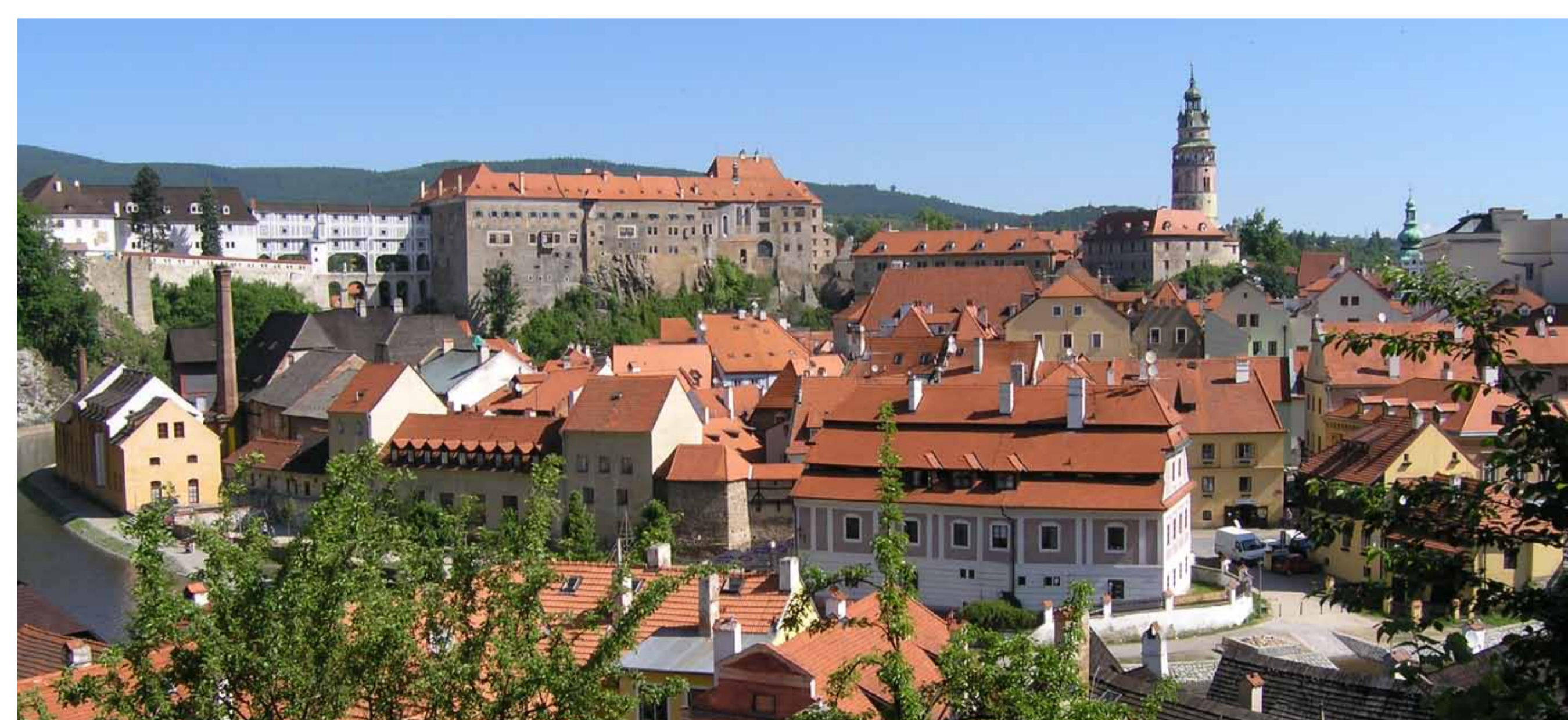
Český Krumlov. Foto: Ladislav Bezděk, 2010, © NPÚ

Den Begriff „Welterbe“ hat die Konvention zum Schutz des Weltkultur- und Weltnaturerbes geprägt, die auf der Zusammenkunft der UNESCO-Generalkonferenz in Paris 1972 angenommen wurde. Ihr Hauptziel besteht darin, der zunehmenden Bedrohung des Kultur- und Naturerbes infolge sozialer und wirtschaftlicher Wandlungen entgegen zu treten, weswegen sie die Pflicht der Signatarstaaten festschreibt, für Schutz, Erhaltung und Weitergabe dieses Erbes an kommende Generationen zu gewährleisten. Mit der Unterzeichnung der Konvention hat jeder der Signatarstaaten seine Pflicht zur Sicherstellung dieses Erbes anerkannt. Im Jahr 1990 ist auch die damalige ČSFR der Konvention beigetreten, Verbindlichkeit erlangte diese am Februar 1991. Ab 1993 hat die neu entstandene Tschechische Republik die Pflichten ihres Vorläufers ČSFR übernommen.